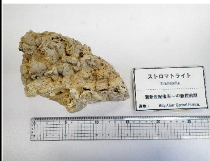
番号:11 ストロマトライト