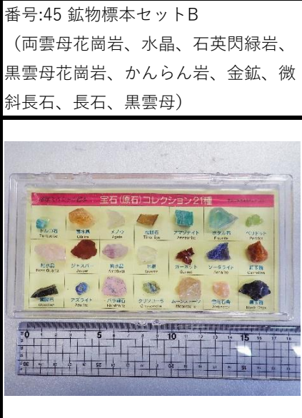
番号:48 宝石コレクションA (21種)