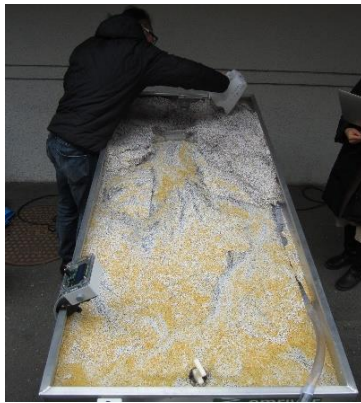
番号:4 リバージオモデル