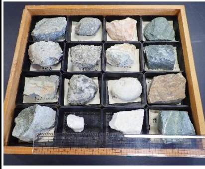
番号:62 変成岩標本 (16個)