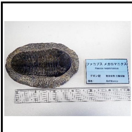
ファコプス メガロマニクス Phacops megalomanicus デボン紀 植物生特 三葉虫類 産地: Newfoundland