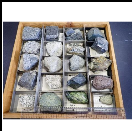
番号:58 火成岩標本 (20個)