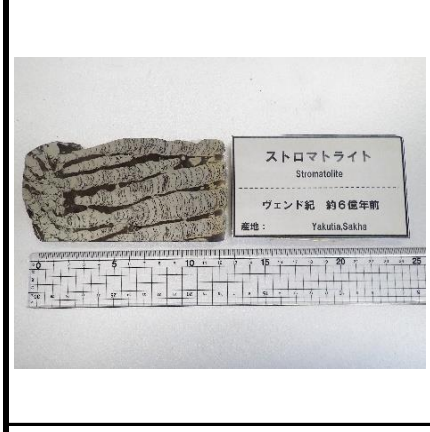
ストロマトライト Stromatolite ウェンド紀 約6億年前 産地: Yukulia, Sakha