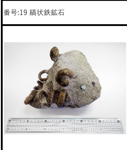
番号:22 アンモナイトの一種 ( Eubostriyoceras sp., Gaudryceras sp.) の化石