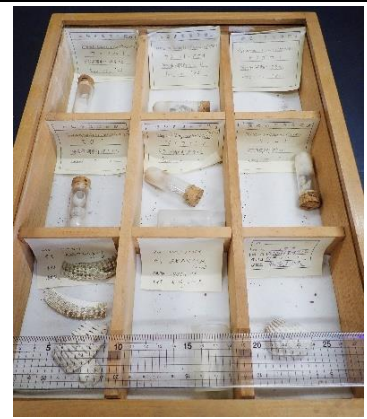
番号:54 貝類の化石A (9種)