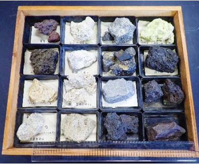
番号:67 火山噴出物 (16個)