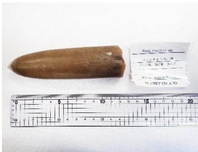
番号:7 ベレムナイトの一種 ( Pachyteuthis sp.) の化石