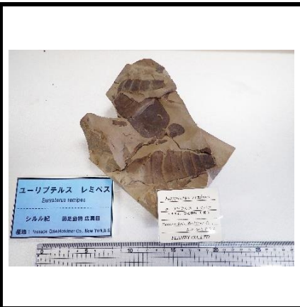
番号:39 ウミサソリの一種 ( Eurypterus remipes ) の化石