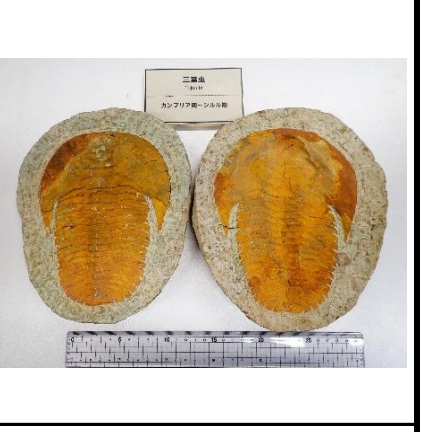
三葉虫 カンブリア期 三葉虫類