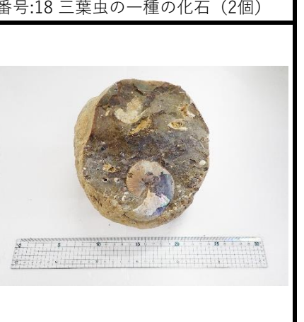
番号:21 アンモナイトの一種の化石