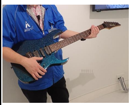
番号:69 モルフォギター