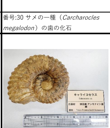
番号:33 アンモナイトの一種 ( Calycoceras sp.) の化石