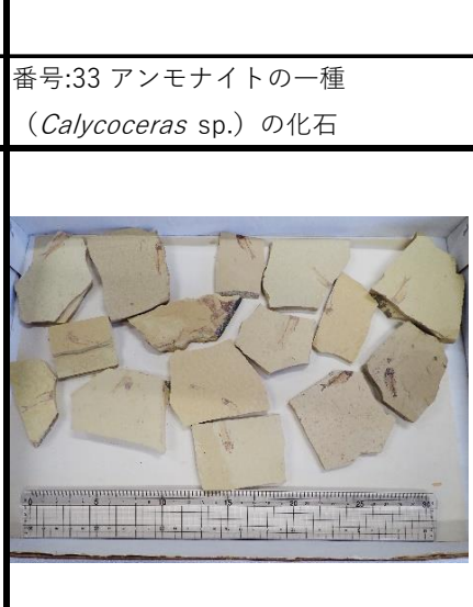
番号:36 魚類の一種の化石 (15個)