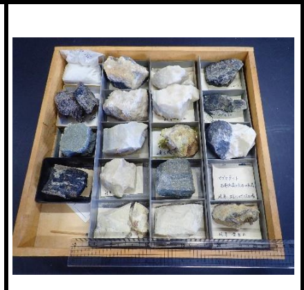
番号:60 造岩鉱物標本 (18個)