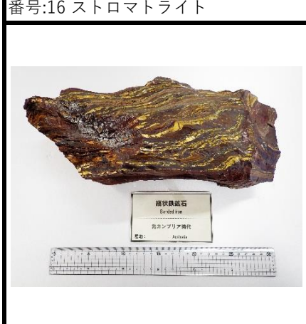
縞状鉄鉱石 Erded Iron 先カンブリア代 産地: Australia