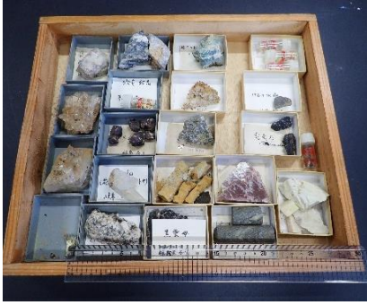
番号:61 鉱物標本 (19個)