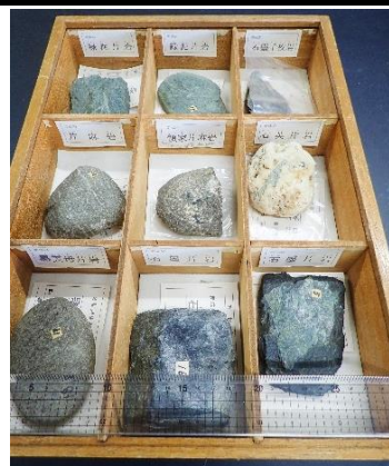
番号:56 変成岩標本 (9種)