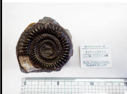
番号:12 アンモナイトの一種 ( Dactyloceras sp.) の化石