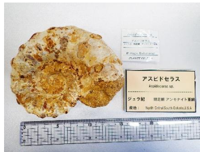
番号:5 アンモナイトの一種 ( Aspidoceras sp.) の化石