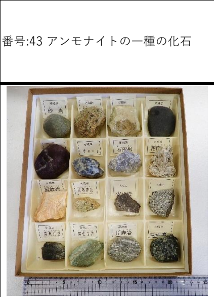
番号:46 天竜川岩石標本A (16種)