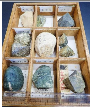
番号:53 火成岩標本B (9種)