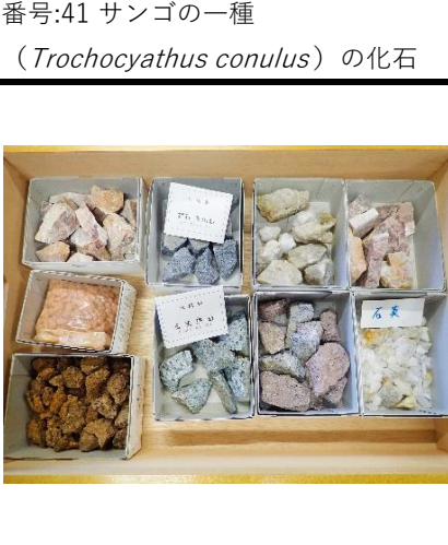
番号:44 鉱物標本セットA (輝石安山岩、ポーキサイト、褐鉄鉱、角閃安山岩、石英、微斜長石、正長石、石英斑岩)