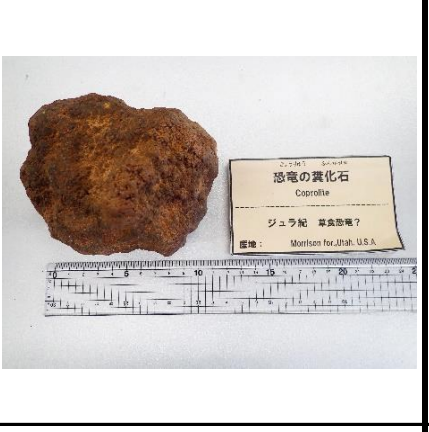
恐竜の糞化石 Coprolite ジュラ紀 暴竜類? 産地: Montana, USA