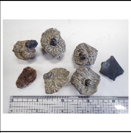
番号:40 三葉虫の一種の化石