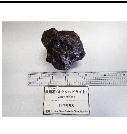
番号:38 鉄隕石 (オクタヘドライト)