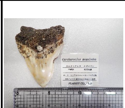
番号:30 サメの一種 ( Carcharocles megalodon ) の歯の化石