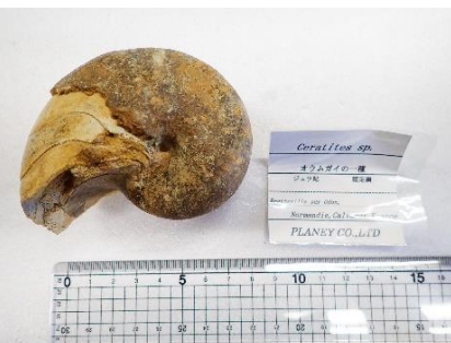
番号:10 オウムガイの一種 ( Ceratites sp.) の化石