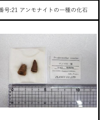
Trochocyathus conulus 三葉虫類 白亜紀 縁足綱 産地: Alaska, USA PLANKY CO. LTD