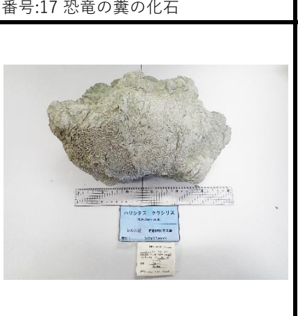
ハリスティス グラシリス Halysites gracilis シルル紀 三葉虫類 産地: Pennsylvania