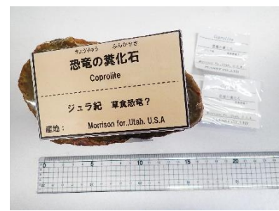
番号:6 恐竜の糞の化石