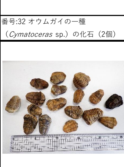
番号:35 三葉虫の一種 ( Diacalymene sp.) の化石