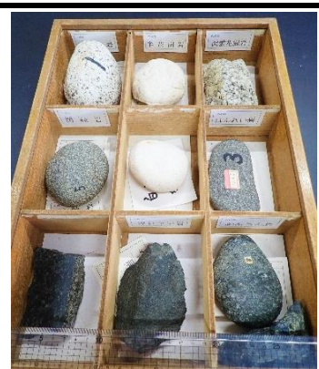
番号:51 火成岩標本A (9種)