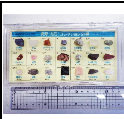
番号:50 鉱石コレクション (21種)