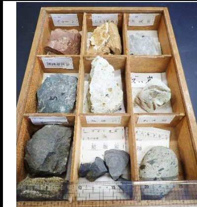
番号:52 たいせき岩標本 (9種)