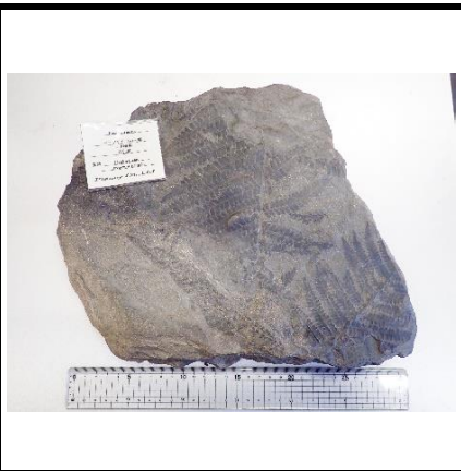
番号:37 シダ植物の一種 ( Pecopteris sp.) の化石