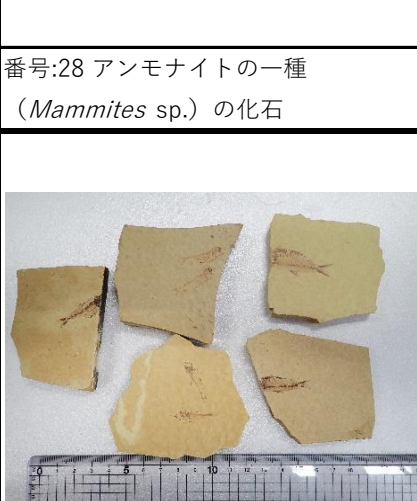
番号:31 魚類の一種の化石 (5個)