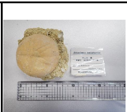
番号:27 ウニの一種 ( Echinolampas hemisphaerica ) の化石