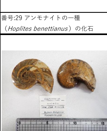
番号:32 オウムガイの一種 ( Cymatoceras sp.) の化石 (2個)