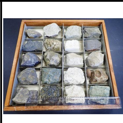
番号:59 鳳来寺山の岩石標本 (20個)