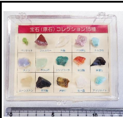
番号:49 宝石コレクションB (15種)