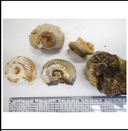
番号:42 アンモナイトの一種の化石