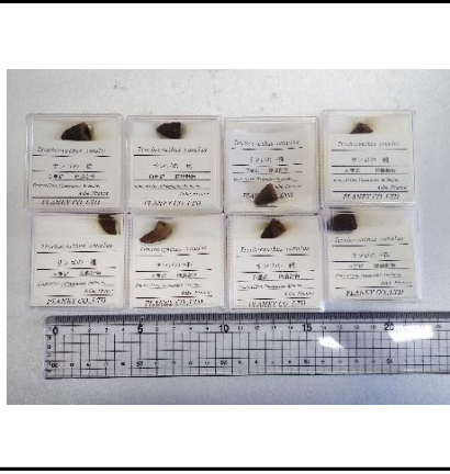
番号:41 サンゴの一種 ( Trochocyathus conulus ) の化石