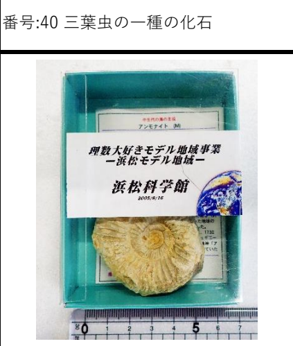
番号:43 アンモナイトの一種の化石