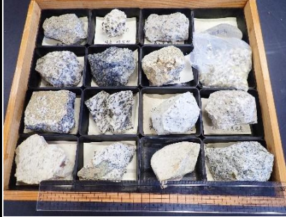
番号:65 花崗岩標本 (16個)