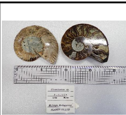
番号:25 アンモナイトの一種 ( Cleoniceras sp.) の化石 (2個)