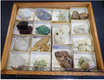
番号:64 岩石標本 (15個)