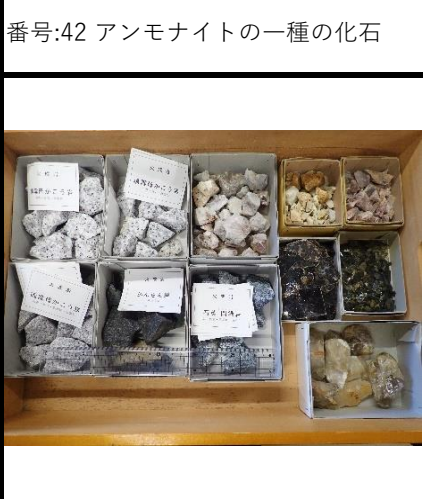
番号:45 鉱物標本セットB (両雲母花崗岩、水晶、石英閃緑岩、黒雲母花崗岩、かんらん岩、金鉱、微斜長石、長石、黒雲母)