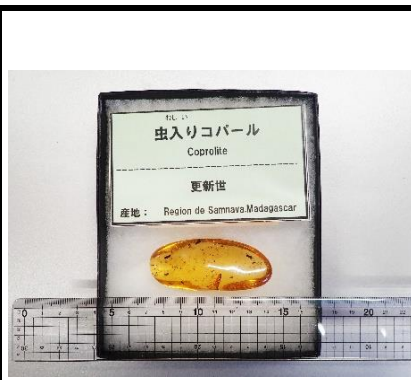
番号:26 昆虫入りの琥珀