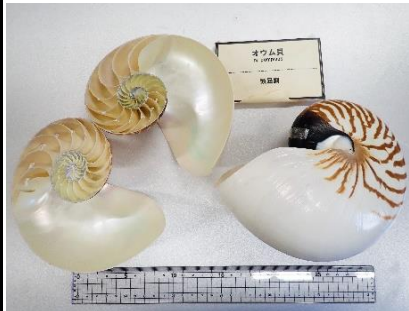
番号:8 オウムガイ ( Nautilus pompilius ) の切断標本 (4個)