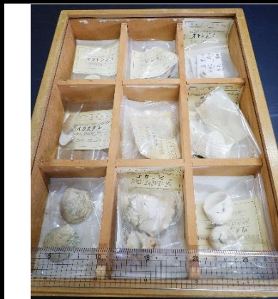
番号:55 貝類の化石B (9種)