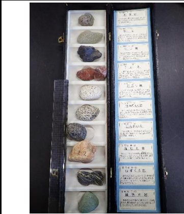
番号:68 天竜川の石 (10個)