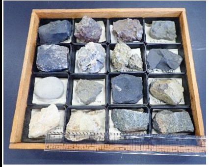
番号:63 堆積岩標本 (16個)