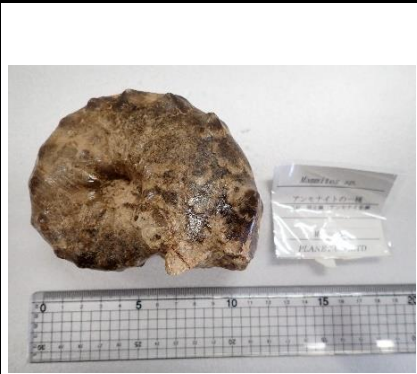
番号:28 アンモナイトの一種 ( Mammites sp.) の化石