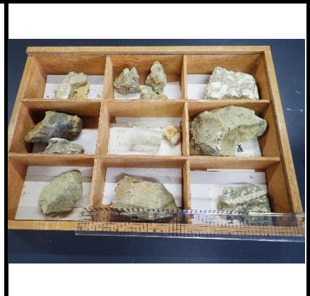
番号:57 貝類の化石C (9種)