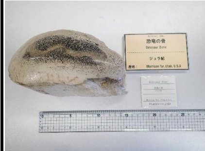
番号:9 恐竜の一種の化石