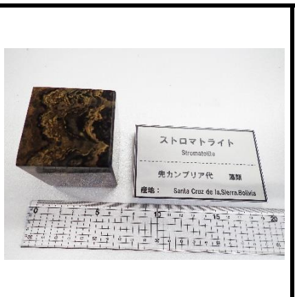
ストロマトライト Stromatolite 先カンブリア代 藻類 産地: Santa Cruz de la Sierra, Bolivia