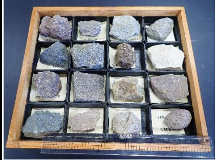
番号:66 安山岩 (16個)