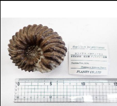
番号:29 アンモナイトの一種 ( Hoplitites benettianus ) の化石