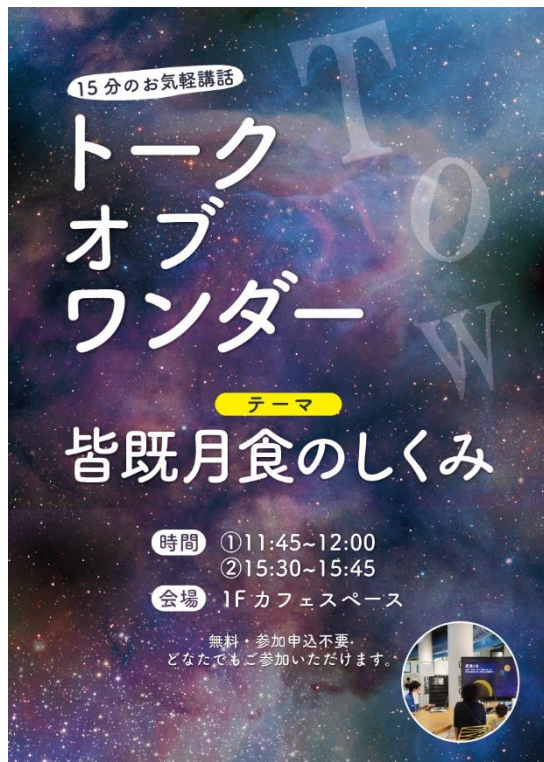
トークオブワンダー ポスター

太陽、地球、月の順に一直線に並ぶと、地球の影に月が入る。地球から見ると、月は輝きを失い、暗くなる。これを『月食』と呼ぶ。また、太陽の光は地球の影の内側へと回り込み、影の濃さは少しずつ薄くなっていく。このとき月は、地球の濃い影と、薄い影の両方に入る距離に位置している。そして、月全体が地球の濃い影に入ることを『皆既月食』という。なお、月の一部が濃い影に入ることを『部分月食』という。