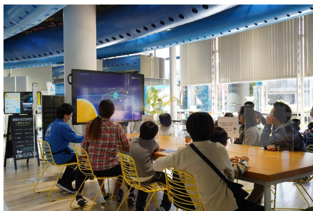
トークオブワンダー開催中の様子