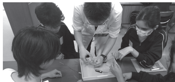
図5：当日の授業の様子