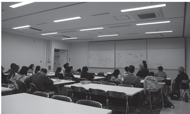
図3：日本語教室の様子