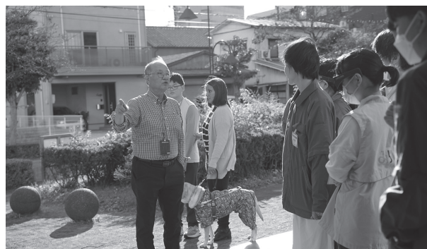
図7：利用者支援研修(視覚障害)

また、市内視覚障害者支援施設ウイズ六星(※6)が運営する「ウイズ蛭塚」「ウイズ半田」「ウイズかじまち」などでの施設見学(7月)をはじめ、利用者支援研修(視覚障害：12月)の講師を依頼するなど、地域の福祉実践者との連携を深めるとともに、浜松特別支援学校磐田分校での出張プログラム実施(9月)や、静岡文化芸術大学のユニバーサルデザイン研究フィールドワークへの協力(8月)など、教育・研究・福祉の各分野を横断した連携も展開しています。