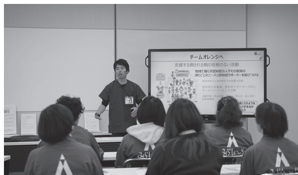
図8：認知症サポーター養成講座