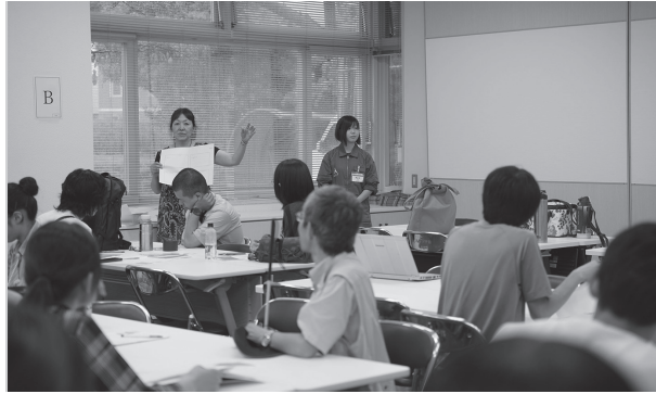
図9：静岡文化芸術大学 UD デザイン研究 FW