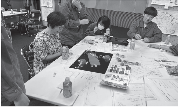
図2：リードユーザーとプロトタイプ制作