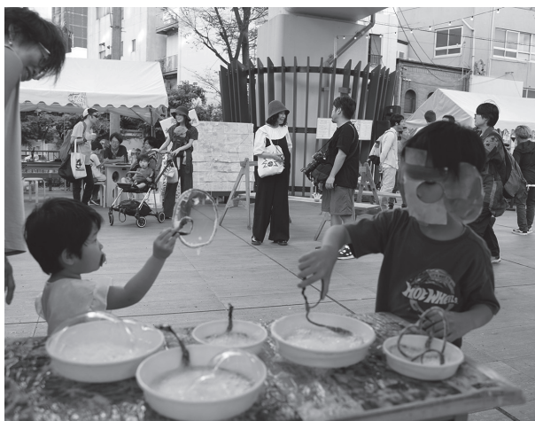
図6：凸凹まつり シャボン玉ブース

福祉とアートを融合させた活動を行う「クリエイティブサポートレッツ」(※5)とは、2024年2月以降、レッツが主催する「凸凹(でこぼこ)まつり」実行委員会への参加を通じて関係を築くとともに、地域における「新しいコミュニティ」づくりや、包摂的な文化イベント運営のあり方を考える機会をいただきました。9月には、凸凹まつりに科学館職員が有志で参加し、ワークショップやブース出展をしました。来場者とともに工作やシャボン玉づくりを楽しむ体験活動を通して、障害の有無にかかわらず、多様な人が交わる場づくりについて、大きな学びと気づきを得ることができました。